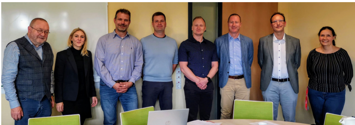
Verhandlungskommission dbb/komba und Geschäftsführung RD LOS

Teilzeitbeschäftigte erhalten die Zahlung anteilig.