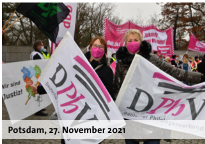
Potsdam, 27. November 2021