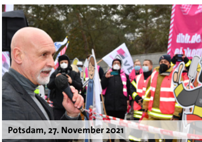
Potsdam, 27. November 2021

Der Wortlaut des Tarifabschlusses ist auf den Sonderseiten des dbb zur Einkommensrunde unter www.dbb.de/einkommensrunde nachlesbar.