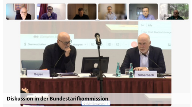
Diskussion in der Bundestarifkommission