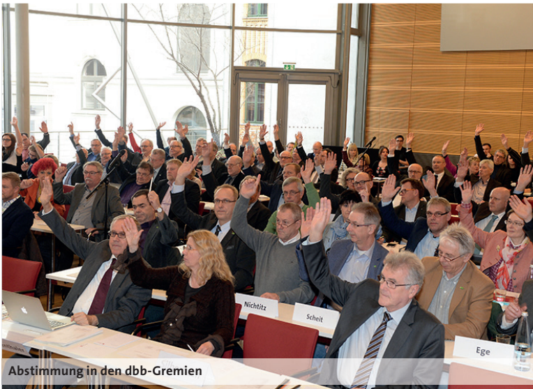
Abstimmung in den dbb-Gremien